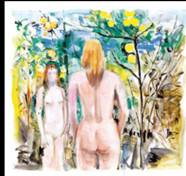
José Hurtado Mena. "Ulterior 2022 Que se dice, sucede o se ejecuta después de otra cosa " Técnica mixta sobre papel Figueres. 220 x 230 cm.