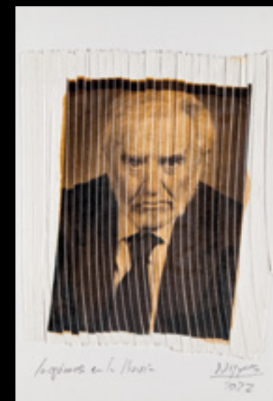
José Carlos Nieves. “Carlos Castilla del Pino.” 21,5x25 cms. Papel de algodón cortado con trituradora de papeel, tinta pigmentada y papel. Edición 2022.