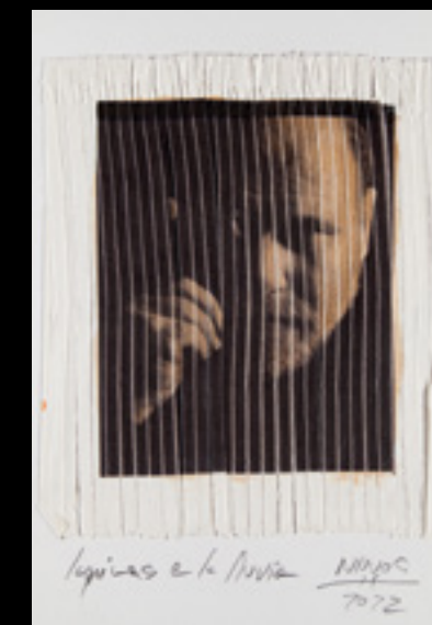
José Carlos Nieves. “Pepe Gálvez.” 21,5x25 cms. Papel de algodón cortado con trituradora de papeel, tinta pigmentada y barniz. Edición 2022.