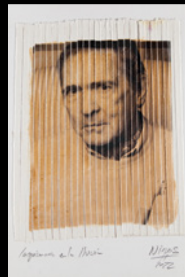
José Carlos Nieves. “Antonio Gala.” 21,5x25 cms. Papel de algodón cortado con trituradora de papeel, tinta pigmentada y barniz. Edición 2022.